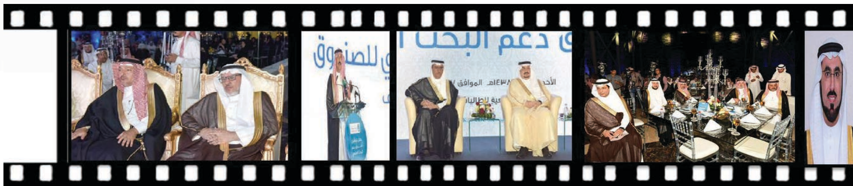
صندوق جامعة الملك سعود لدعم البحث العلمي