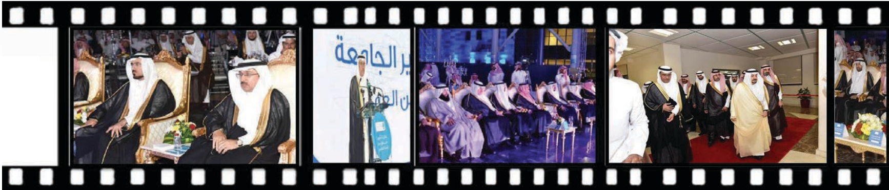
صندوق جامعة الملك سعود لدعم البحث العلمي